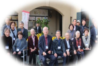
(宝塚サービスエリアにて)

良いお天気に恵まれ、11月15日立教記念祭にバス参拝させて頂きました。前日に鷺羽山グランドホテル 備前屋甲子に一泊して、ゆっくりと参拝させて