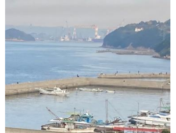
(朝の瀬戸内海 ホテル4階から)

TEL077 (587) 1624 FAX077 (587) 1867 Eメール shinohara-ko373@hotmail.co.jp