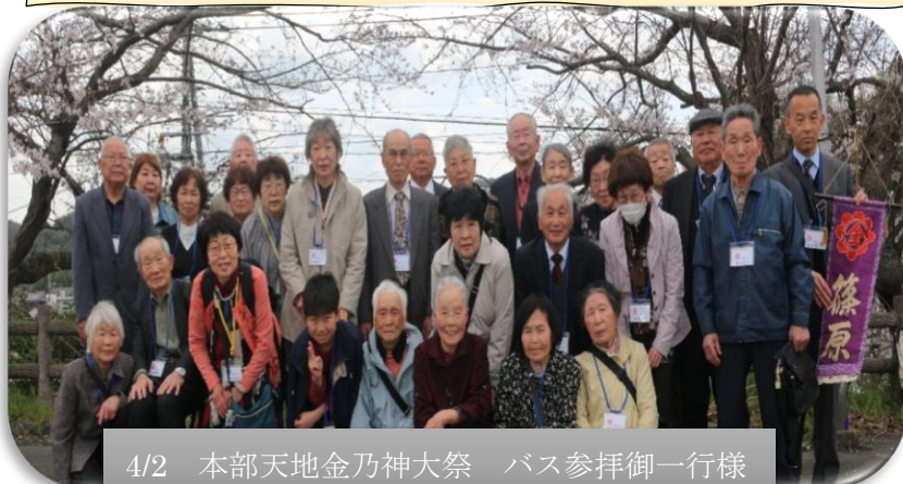
4/2 本部天地金乃神大祭 バス参拝御一行様